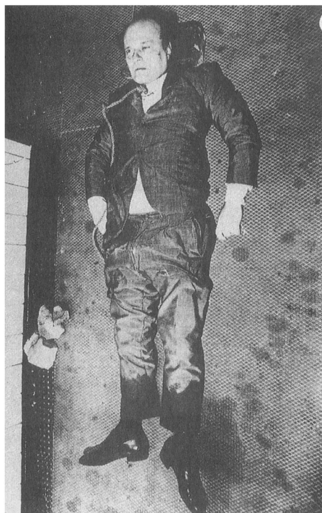
Roberto Kalvi, „Božji bankar“, pronađen je obešen ispod jednog mosta u Londonu

Nadležni u Skotland jardu, razmišljajući na tipično engleski način, pretpostavili su da je ovaj italijanski gospodin u očajanju sebi oduzeo život zbog bankrota svoje banke Ambrozijano . Ukoliko bi se ova hipoteza prihvatila kao tačna, onda je i Kalvijeva sekretarica dobrovoljno otišla u smrt, kada je samo nekoliko sati kasnije pala ili se bacila s prozora jedne poslovne zgrade u Milanu. I Serđo Vakari (Sergio Vaccari), osumnjičen za ubistvo Kalvija, kasnije je, navodno, sâm sebi razbio glavu u svom stanu u Londonu i nekoliko puta se izbô nožem, što je konstatovano kao uzrok njegove smrti. Drugi osumnjičeni, Vinčenco Kaziljo (Vincenzo Casillo), iskomplikovao je svoj dobrovoljni odlazak na onaj svet pošto je u